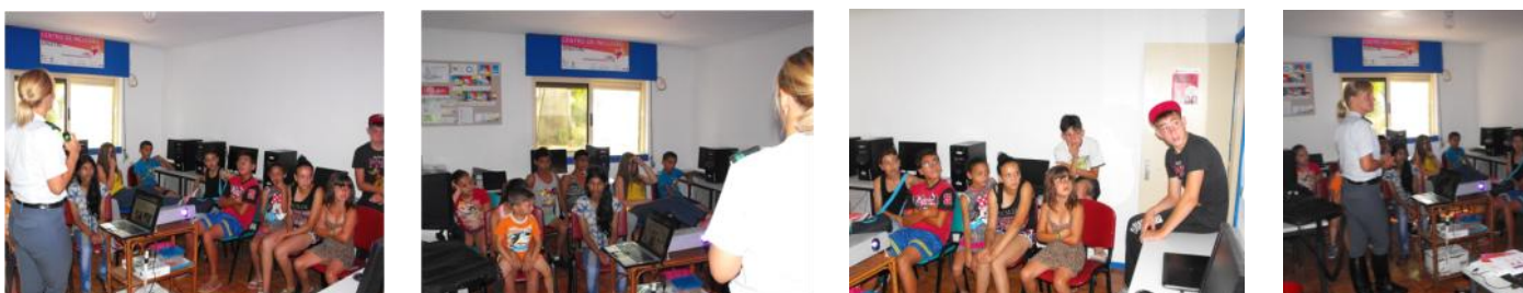
Sessão| Não ao bullying

Este foi o tema que a Guarda Nacional Republicana debateu com os jovens do Projeto InOut-E5G, numa sessão muito interventiva e participada, de modo a sensibilizá-los e informá-los acerca desta problemática que tem marcado a nossa sociedade atual.