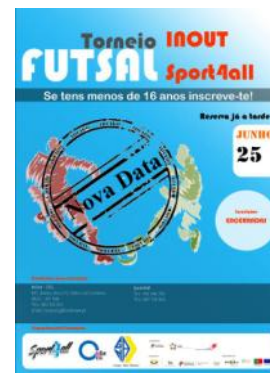
Torneio de futsal