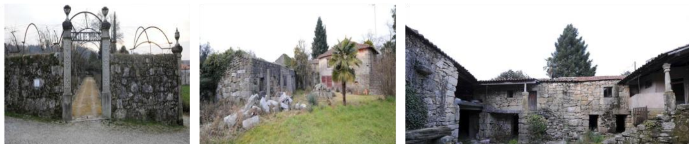
Casa de Docim antes da intervenção

Neste sentido, com os apoios previstos, foram criadas diversas unidades de alojamento de turismo em espaço rural no território de intervenção da Sol do Ave, destacando-se neste edição a Casa de Docim. Situada no Concelho de Fafe, esta nova unidade de turismo em Espaço Rural, resultou da recuperação de uma Casa Rural do Séc. XVIII e da sua área envolvente, em harmonia com o seu passado, transformando-a num espaço acolhedor, familiar e cultural .