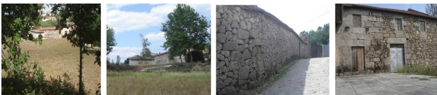
Quinta do Minhoto antes da intervenção

“Nascer Minhoto significa ficar para sempre com a retina ligada aos incontáveis tons de verde, às serras e aos rios, que ao mesmo tempo dividem e unem aldeias, vilas e cidades. É ter nos ouvidos o som poderoso dos tambores e da música das concertinas que com a sua alegria contagiante, nos empurra para a dança...”