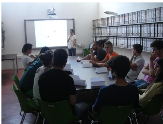
Drogas em debate

Como qualquer discussão sobre um assunto complexo, as respostas fáceis dissiparam-se e das perguntas surgiram novas perguntas. E se “a dúvida é o princípio da sabedoria” (Aristóteles), então estamos no caminho certo!