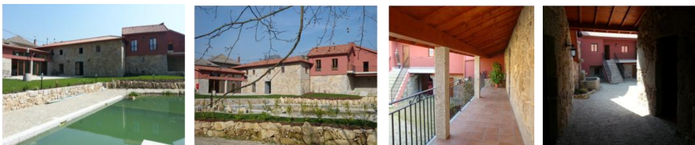
Quinta do Minhoto após intervenção

Para mais informações e/ou reservas, aceda a www.quintadominhoto.com .