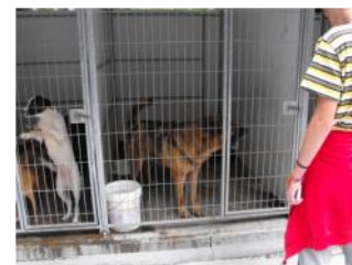
Canil Municipal de Fafe