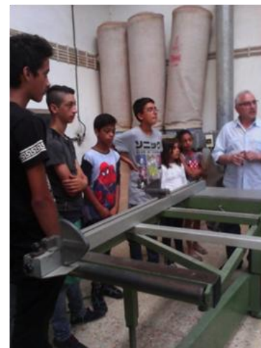
Instalações da CERCIFAF