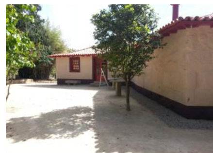
Casa de Docim após intervenção