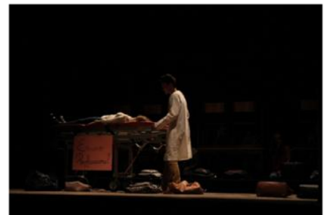
Apresentação da peça de teatro [B]Urro!