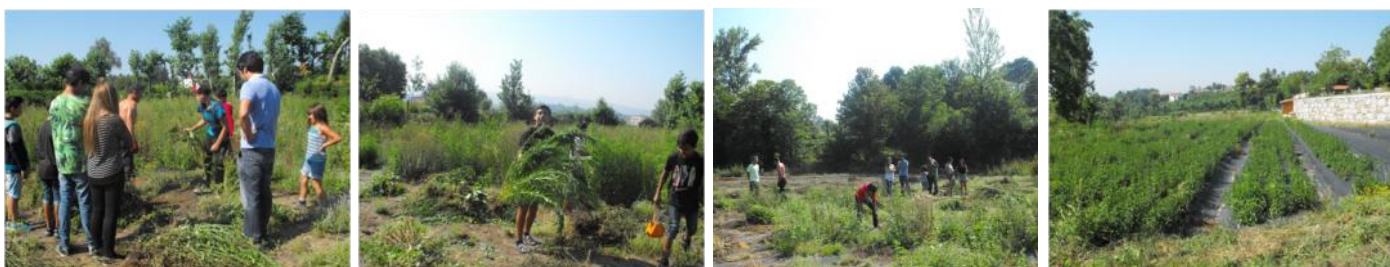
Casas do Ermo