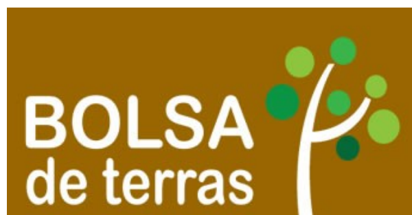
Logótipo Bolsa Nacional de Terras