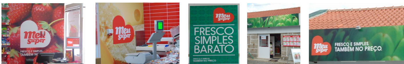
Supermercado Meu Super

Este projeto contou com a criação de 2 postos de trabalho e, segundo o proprietário, com apenas 5 meses de atividade, está a ir ao encontro das suas expectativas, esperando um crescimento e sustentabilidade do seu negócio.