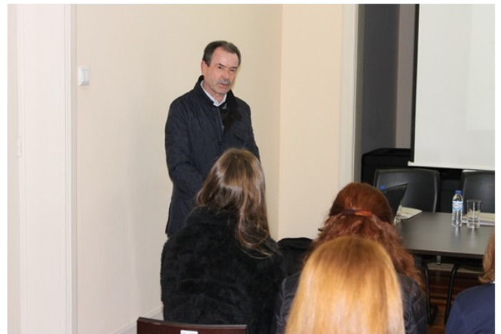
Abertura do Colóquio