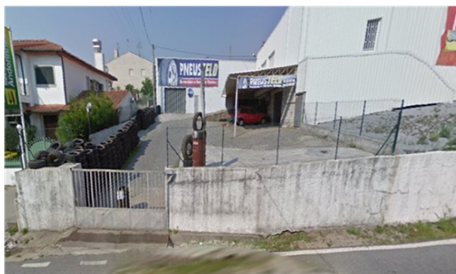
Local de estágio

Atualmente, alguns jovens encontram-se a realizar estágios em diversos estabelecimentos, nomeadamente, na área de venda e reparação de bicicletas, reparação de automóveis, informática e equitação.