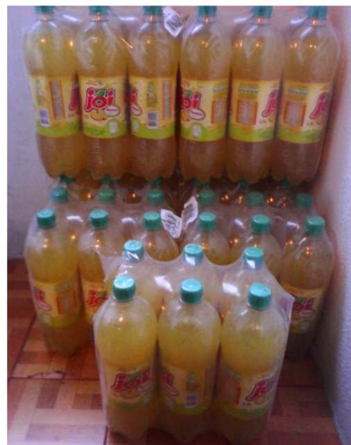
Bolachas e sumos doados