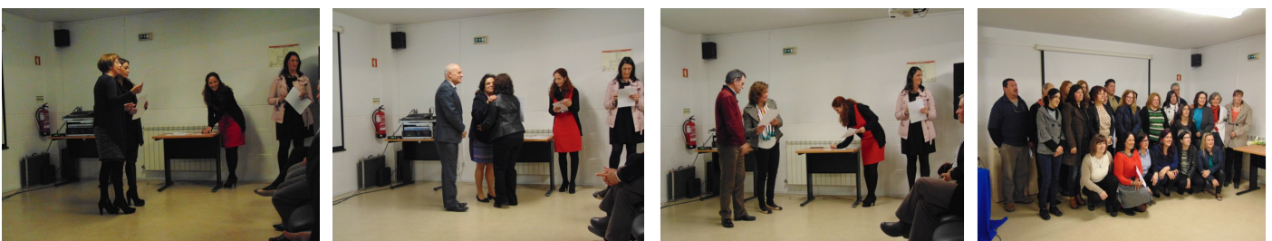
Entrega de certificados