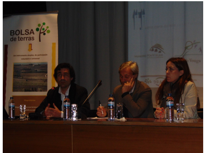
Mesa de convidados