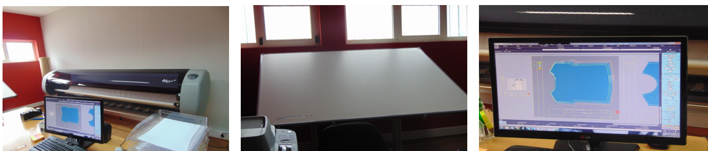
Gabinete de Modelagem Métrica

Este projeto é encarado como um reforço à indústria têxtil, a qual tem a possibilidade de contratar os serviços de profissionais especializados nesta área.