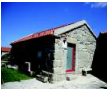
Casa da Eira