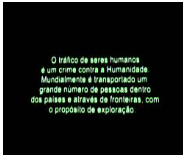
Sessão de sensibilização