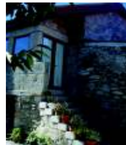
Casa do Cera