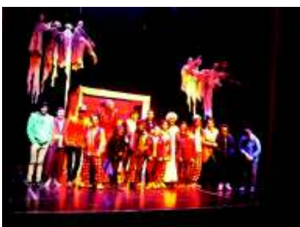
Teatro “Os sonhos de D. Quixote”

“Os sonhos de D. Quixote” foi a peça de teatro que os/as participantes do projeto tiveram oportunidade de assistir, no Teatro-Cinema de Fafe. Para além disso, houve lugar a uma sessão de cinema, nas instalações do InOut-E5G, de modo a assinalar a inauguração da sala, recentemente renovada.