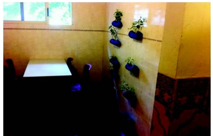
Horta vertical interior