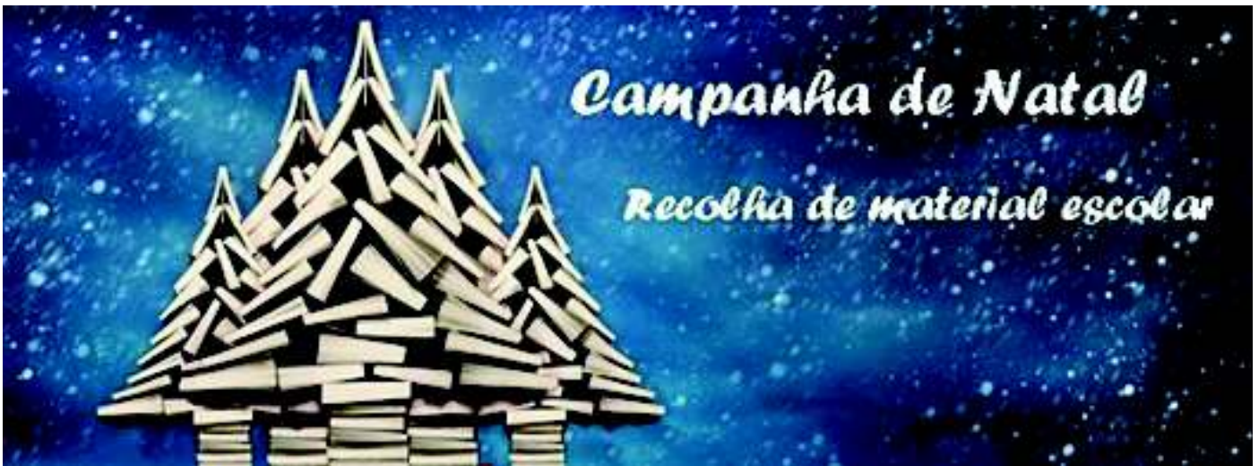
Campanha de Natal

Durante o mês de dezembro, o Projeto InOut-E5G lançou uma campanha de recolha de todo o tipo de material escolar, com o intuito de distribuir, no dia da festa de Natal, a todos/as os/as seus participantes.