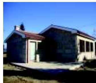
Escola EB1 Espindo