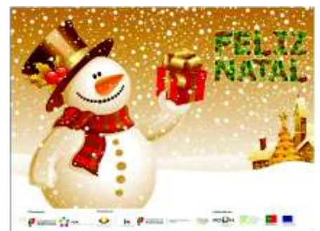
Postais de Natal elaborados pelos/as participantes do Projeto InOut-E5G