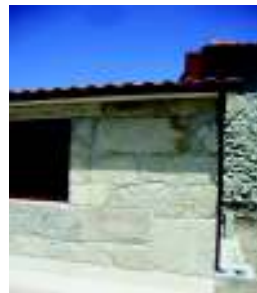
Horta dos Figos