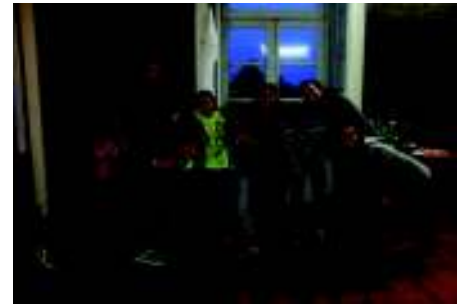
A sala do projeto após intervenção