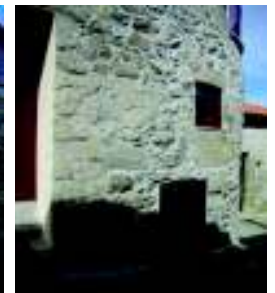
Casa Pedra da Rua