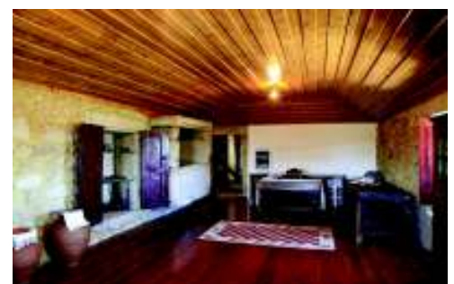
Casa da Gaiteira