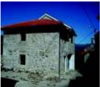
Casa do Zé Grande

Inserido neste aglomerado, foi criado o Polo Interpretativo de Espindo, alusivo às vivências e tradições da aldeia em atividades como a agricultura, neste caso específico a pastorícia. A relação homem/ lobo, a criação e localização dos fojos, o abrigo dos pastores e chãs são temas patentes na área de exposição, para além de equipamento multimédia para a realização de atividades pedagógicas.