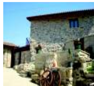
Casa do Quintas