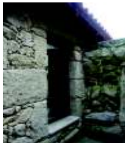
Casa dos Alpinistas