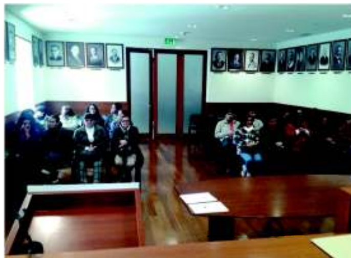
Cerimónia de entrega de certificados