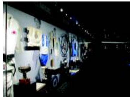
Estádio do Dragão e Museu do Futebol Clube do Porto

“Os sonhos de D. Quixote” foi a peça de teatro que os/as participantes do projeto tiveram oportunidade de assistir, no Teatro-Cinema de Fafe. Para além disso, houve lugar a uma sessão de cinema, nas instalações do InOut-E5G, de modo a assinalar a inauguração da sala, recentemente renovada.