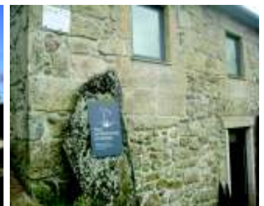
Polo Interpretativo de Espindo

No que se refere à dinamização das atividades económicas e socioculturais, destacamos a criação de uma unidade de alojamento de Turismo em espaço Rural, a Casa da Gaiteira. Com 8 unidades de alojamento, 2 salas de estar e uma de refeições, para além de uma piscina e balneários de apoio, este empreendimento dispõe de uma vista magnífica para o Gerês.