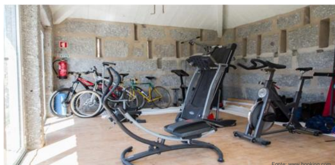
Interior e ginásio da Casa de Campo Le Jardin