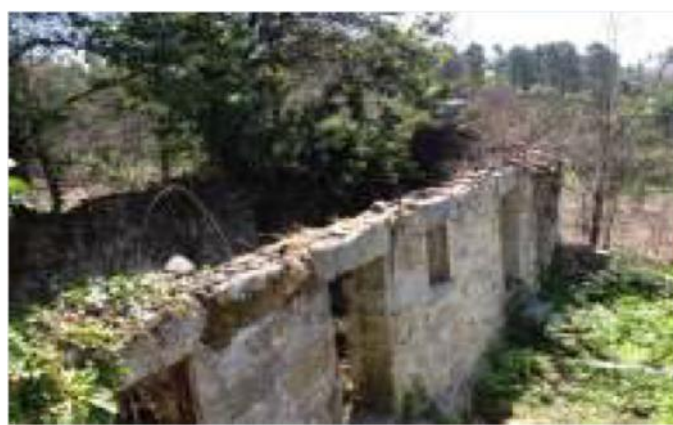
Le Jardin antes da intervenção