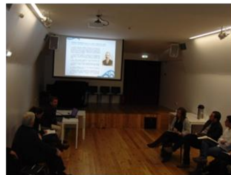
Comunidade Empreendedora Social Angels