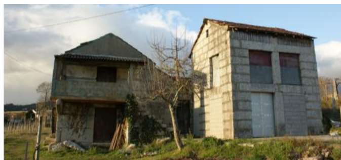
Quinta Lama de Cima antes da intervenção