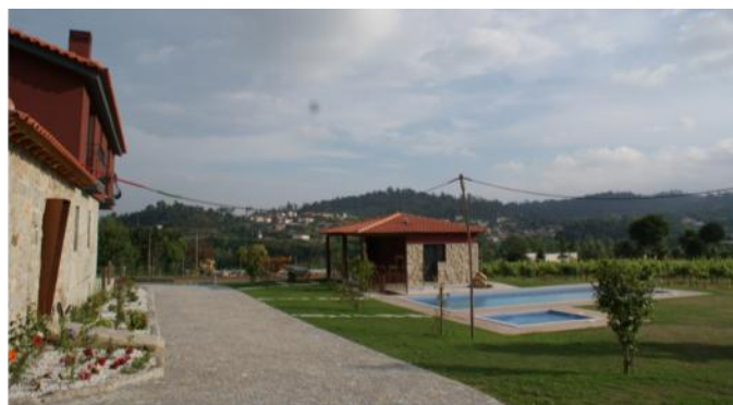
Exterior da Quinta Lama de Cima