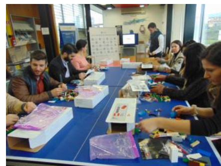
Comunidade Empreendedora Social Angels