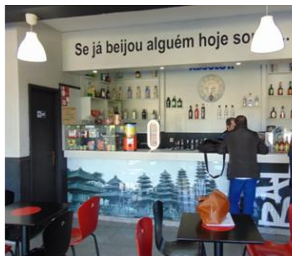
Esplanada e interior do café