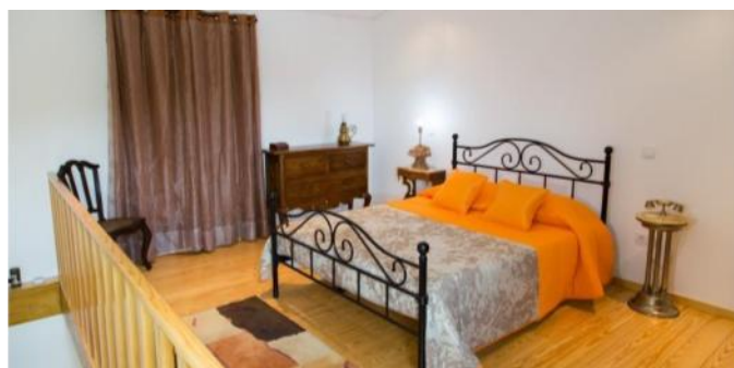
Interior da Quinta Lama de Cima