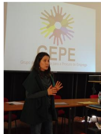
Sessão de lançamento dos GEPE na Biblioteca Municipal Raul Brandão