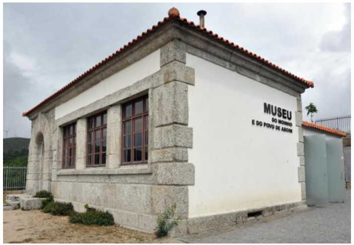
Recuperação da escola primária de Aboim