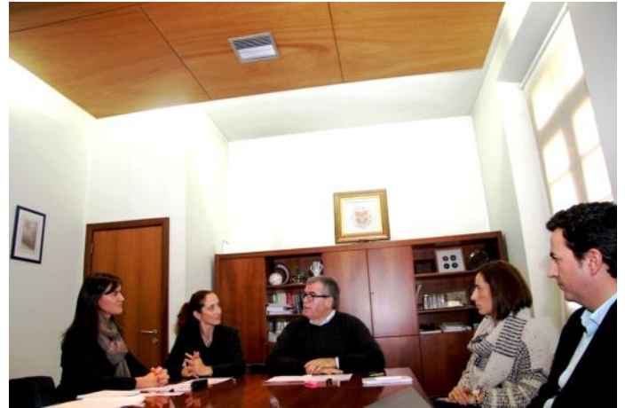
Apresentação do projeto Social Angels - Comunidade Empreendedora