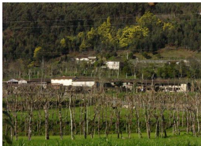
Quinta Pedras de Baixo antes da intervenção

De modo a complementar a visita dos turistas e atrair novos, foi criado um plano de atividades que visa a sua participação nos trabalhos agrícolas (tanto na quinta, como na aldeia); o contacto com a música de cariz popular; passeios pedestres e/ou de bicicleta; promover a arte e o artesanato em ambiente rural e realizar exposições; organizar workshops sobre as culturas agrícolas, ervas aromáticas, chás, compotas e doçaria regional, bem como servir refeições em potes de ferro e cozinhadas a lenha, segundo os processos tradicionais e ancestrais da gastronomia minhota.