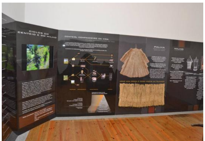
Centro Interpretativo da Montanha e do Centeio de Aboim

A criação deste centro, na freguesia de Aboim, permitiu a valorização do património e recursos endógenos, o que fez aumentar exponencialmente a capacidade de atração turística à região. Por outro lado, foi possível a fixação de um posto de trabalho, tendo em consideração o elevado número de visitantes ao local. Por fim, foi possível recuperar a função educativa e afirmar Aboim como recurso de excelência da oferta educativa regional, sendo este espaço considerado como um ponto de visita obrigatória das escolas.