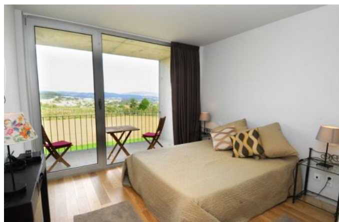
Quinta Pedras de Baixo após intervenção

Para mais informações, ou marcações, aceda ao site da Quinta Pedras de Baixo - Agroturismo, através de: http://www.pedrasdebaixo.pt/